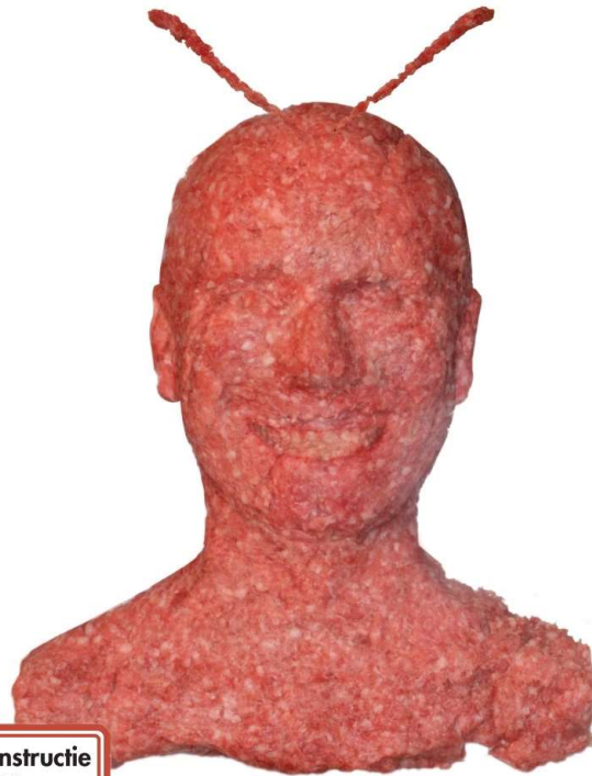
Reconstructie Met Voelsprietten